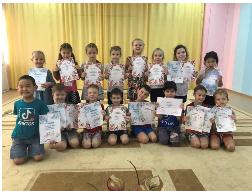
Награждение участников викторины «Зимующие птицы»