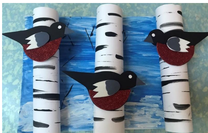
Творческие работы на тему «Встречаем зимующих птиц»