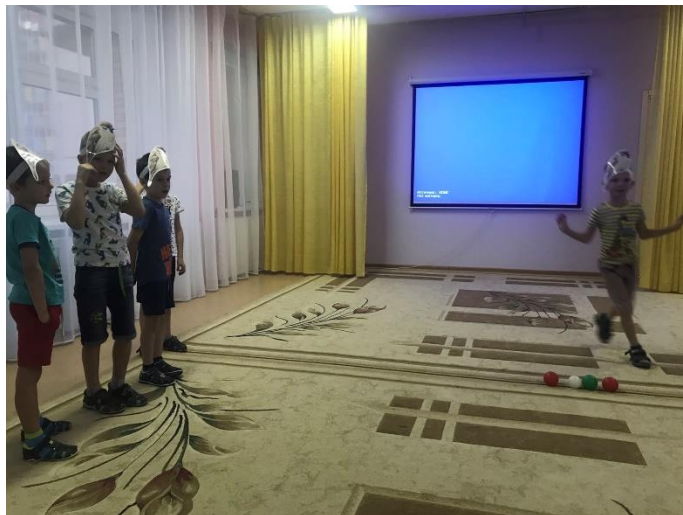
Инсценирование песни «Аппетитней, веселей»