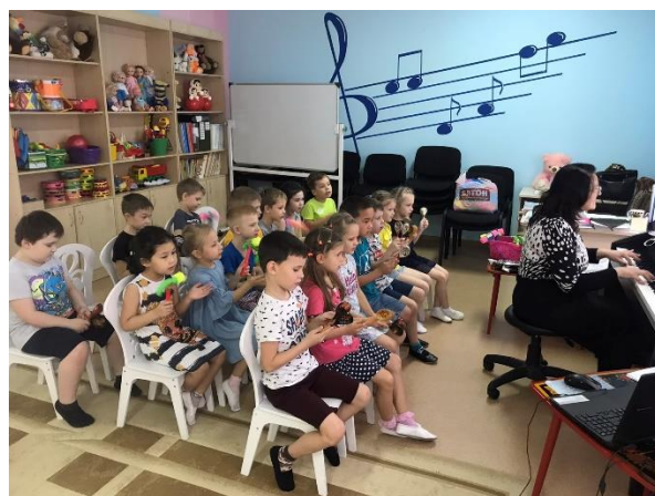
Оркестр музыкальных инструментов - песня «Дятел».