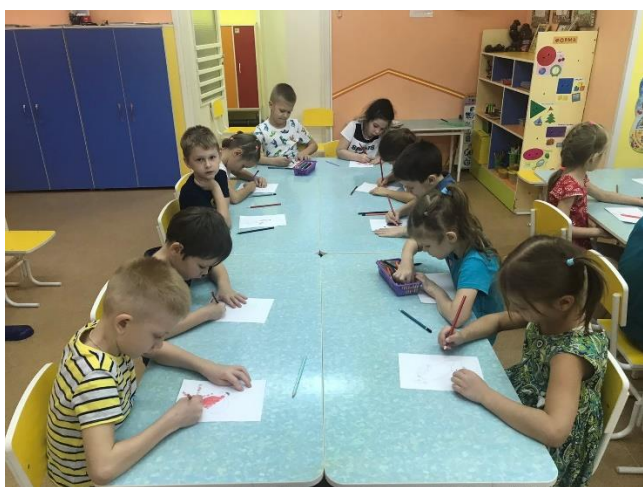
Рисование «Снегирь на ветке рябины»