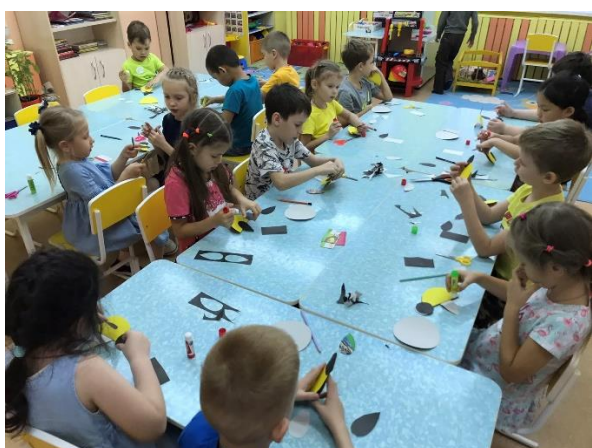
Апликация «Стайка синиц»